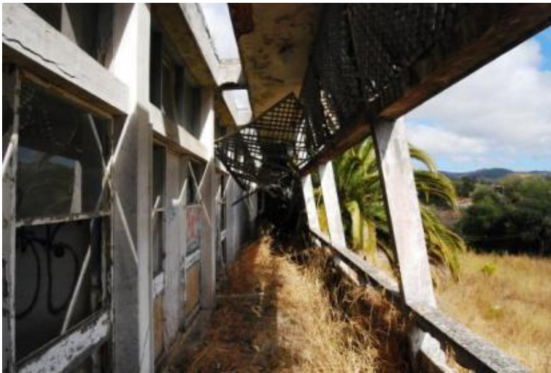
Centro de Assistência Social Polivalente de Aljezur / Creche da Misericórdia de Aljezur, 1957