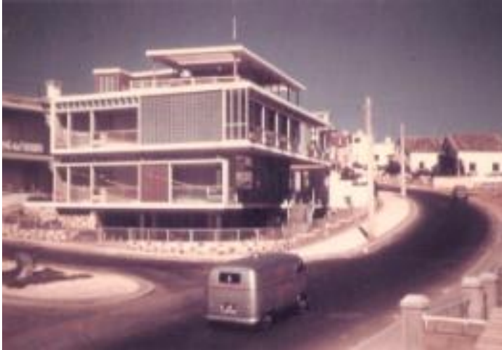
Casa Alfredo Gago, Faro – projecto de 1956