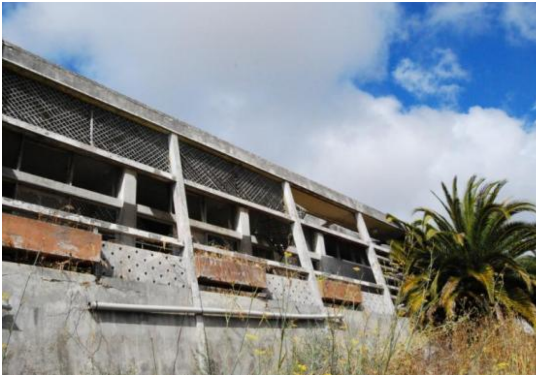
Centro de Assistência Social Polivalente de Aljezur / Creche da Misericórdia de Aljezur, 1957