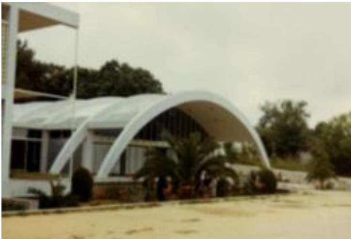
Colégio de Nossa Senhora do Alto, Faro – projecto de 1960