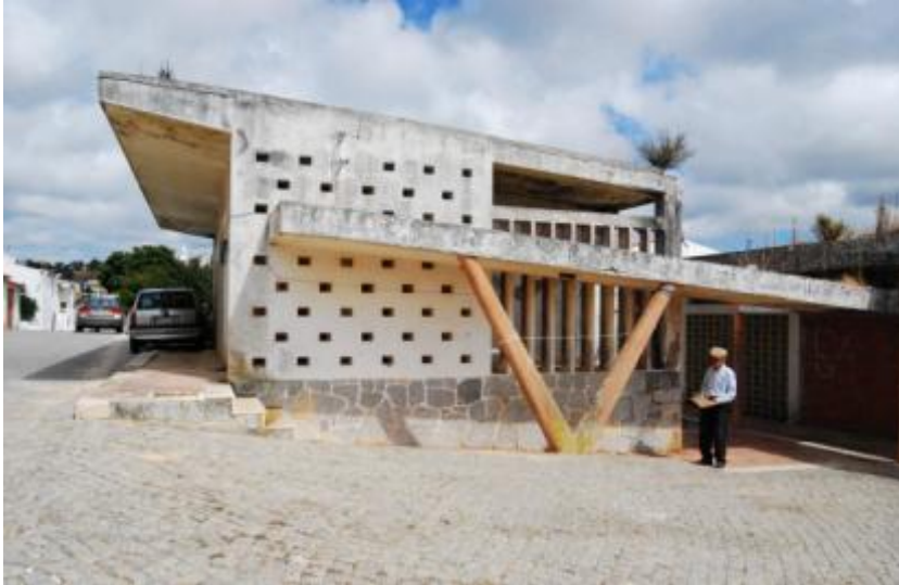
Centro de Assistência Social Polivalente de Aljezur / Creche da Misericórdia de Aljezur, 1957